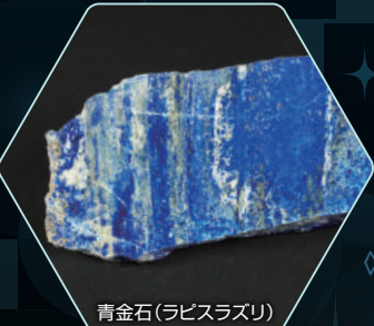
青金石 (ラピスラズリ)