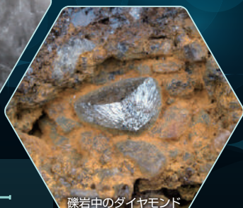
礫岩中のダイヤモンド