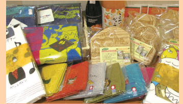
社会福祉法人 愛媛県社会福祉事業団

花苗(スマレ等)/障がい者デザインタオル ポインセチア/シクラメン/フリルサラダ/ ブロッコリー/里芋/不知火ジュース/ しらぬいボン酢/みきゃんマグネット3種/ みきゃん木札3種/みきゃんスマホ3種/ 木の車/木のSL/切り文字/プラケース入 カレンダー/木製台付カレンダー/ 麦ごはんぱん/黒糖くるみぱん