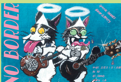
15:20～ NO BORDER LIVE