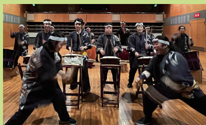
14:00～ 松山水軍太鼓演奏 鼓楽奏団 庵灯鼓