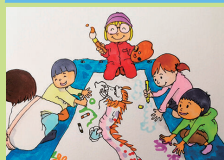
えがお 愛顔の龍をデザインしよう