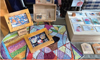
就労継続支援B型事業所 Visee

クッキー/乾シイタケ/ ミカンのジャグチ木箱からジュース/ 日本ミツバチの百花蜜「森のひとしづく」/ 温州みかんゼリー「みんなのジャグチ」