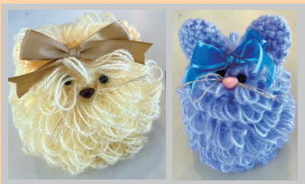
まこと (城北事業所)

ランチパック/はしおき/ネコの爪とぎ/ ピアス/イヤリング/いす/さつまいも/しょうが/ さといも/もち米(5合)/黒米/ボン菓子(小)