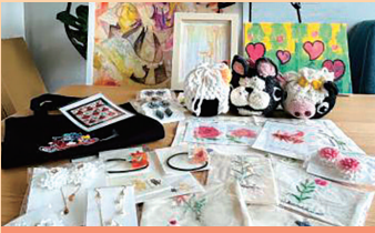
ヒカリのアトリエ