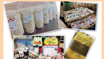
自立支援サービスセンターアユラⅢ

ダイヤモンドアート/マグネット/コースター/ キーホルダー/鍋敷/ハーバリウムボールペン/ 眼鏡チェーン/雑貨セット