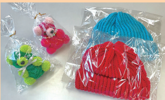
就労継続支援B型事業所 ハロ

ニット帽(子供用)(大人用)/マフラー/ ボンボンベアー/ ボンボンベアー(アクセサリ付き)/ ストラップ(キーホルダー)