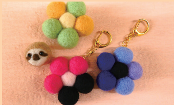
就労継続支援B型事業所 どんまいクラブ

オーメント/メモスタンド/ インテリアオブジェ/バッグ2種/ 巾着/シュシュ/ポーチ/ティッシュケース/ サテンリボン雑貨