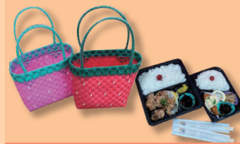
就労継続支援B型事業所 Radiant

アップルパイ/ スイートポテトパイ/チョコパイ/もちパイ/ マロンパイ/チーズケーキパイ