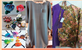
就労継続支援B型 草(かや)

フェルトマスコット(5種)/ レジンアクセサリ(5種)/ 編みぐるみ(4種)/クッション/座布団/ バッグ5種/蒸しパン(2個入り)/アスパラ