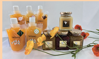
株式会社ワークメイト樹

【ゼリー】 温州/不知火/伊予柑/清見/美生相/ せとか/ぶどう 【ジャム】 デコボン/りんご/キウイ/イチゴ/伊予間