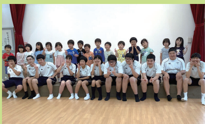
11:15～ ゆかいなふぞくの仲間たち (愛大附属特別支援学校・愛大附属幼稚園)