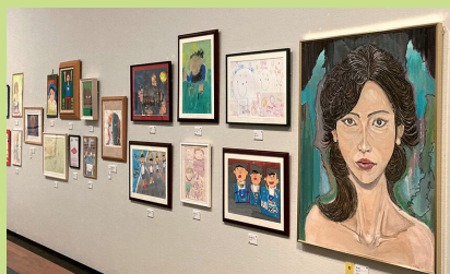
15:00～ えひめの障がい者アート展・ えひめの舞台芸術の紹介