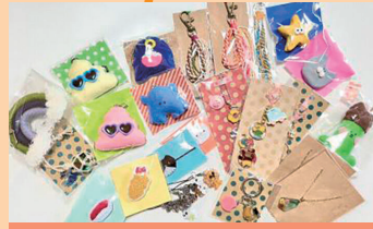
就労支援事業所 さくらす

フェルトマスコット(5種)/ レジンアクセサリ(5種)/ 編みぐるみ(4種)/クッション/座布団/ バッグ5種/蒸しパン(2個入り)/アスパラ