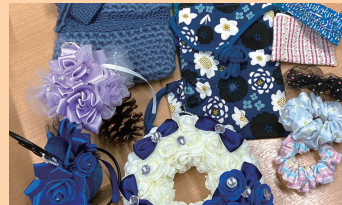
就労継続支援A型事業所 えがお

オーメント/メモスタンド/ インテリアオブジェ/バッグ2種/ 巾着/シュシュ/ポーチ/ティッシュケース/ サテンリボン雑貨