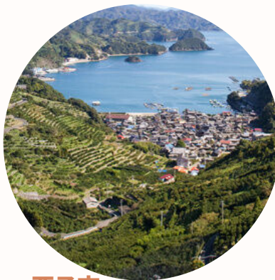
西予市 日本ジオパーク認定の 自然に囲まれた海・里・山暮らし