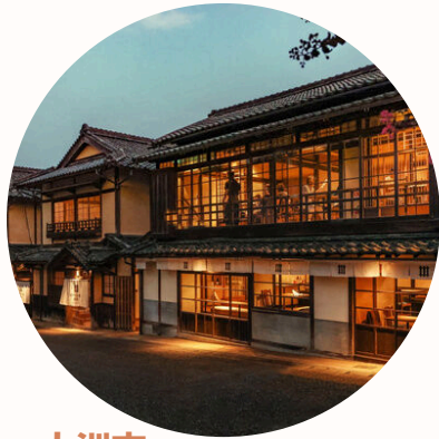
大洲市 里山も海もある ノスタルジックな伊予の小京都