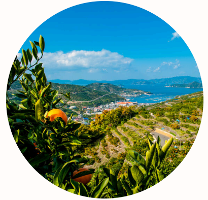
八幡浜市 ブランドみかんの産地 コンパクトな田舎暮らし