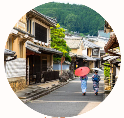
内子町 南予地域の玄関口 ちょうどいい田舎暮らし