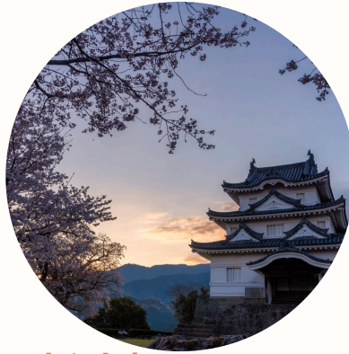
宇和島市 南予地方の中心都市 タイ・ブリ・真珠の養殖が盛ん