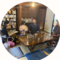
先輩移住者との交流