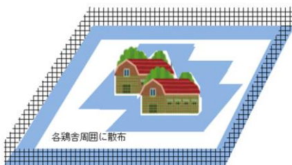
各鶏舎周囲に散布 農場周囲に散布