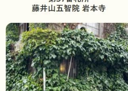
四国八十八ヶ所霊場第37番札所 藤井山五智院 岩本寺