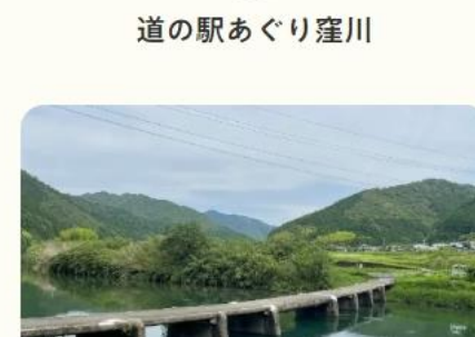
道の駅あくり窪川