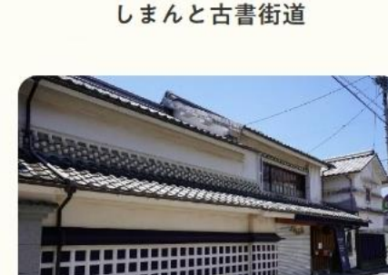
しまんと古書街道