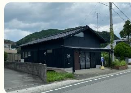
コワーキングスペース warmth