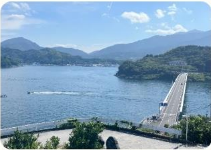
道の駅きさいや広場