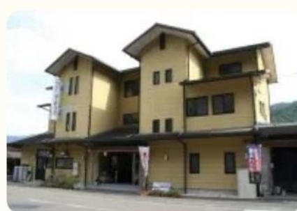
道の駅四万十とおわ