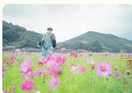
旧庄屋 毛利家屋敷