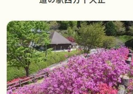
道の駅四万十大正