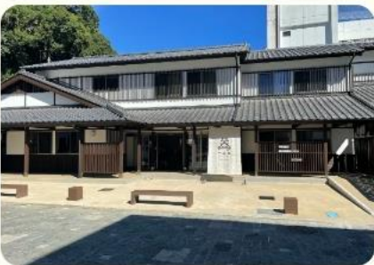
商店街・牛鬼ストリート