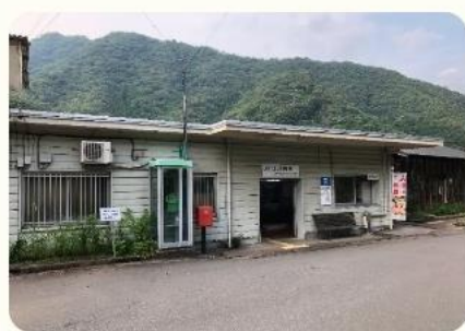
道の駅よって西土佐