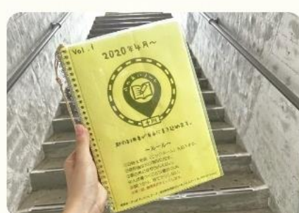
清流四万十の里 十和温泉