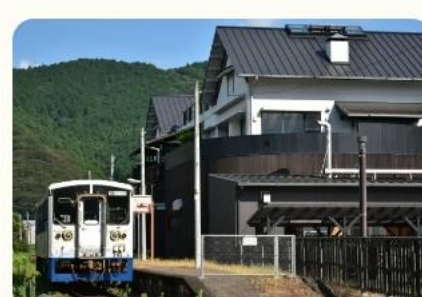
道の駅虹の森公園まつの