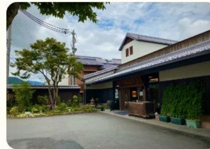
道の駅広見森の三角ぼうし