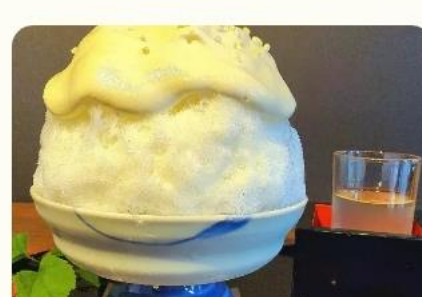
カフェレストランミー