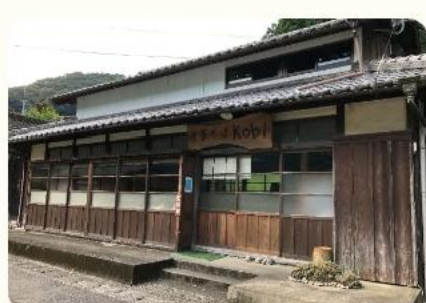
四万十・川の駅カヌー館