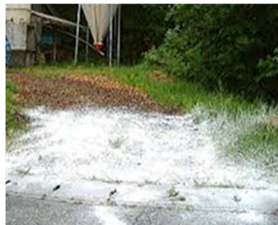
写真1 鶏舎周辺までの消石灰散布