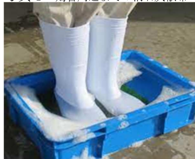
写真2 踏込消毒槽の設置