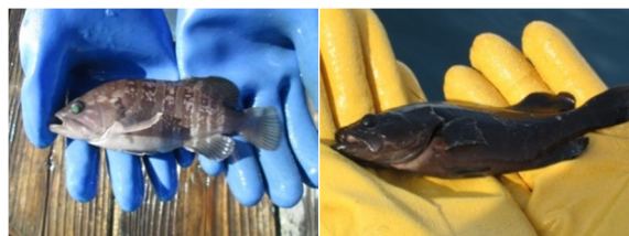
図4 マハタ (左)、クエ (右) の種苗

我々がマハタとクエの種苗生産に愛情と情熱を注ぎ、それを受け取った漁業者さんも飼育に愛情と情熱を注ぐことで、消費者の方々に愛されるマハタとクエになるのだと思います。マハタとクエの種苗生産は、まだまだ課題が多いですが、① 1 尾でも多く生き残るようにし、② 1 尾でも奇形を少なくし、③ 1 円でも安く供給できるようにするのが我々の使命です。