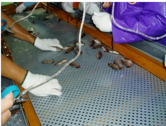
図3 マハタへのワクチン接種風景

そのような中、平成 24 年度に救世主が現れました。長年の研究成果によりワクチンが登場しました！このワクチンは、8g 以上のマハタに接種できるため、そのサイズになるまでは病気にかからないように神経をすり減らして飼育しますが、ワクチンを打ってからは、安心して沖合で飼育することができます。今後は、マハタだけでなく、クエにも打てるようになることが、大いに期待されます。