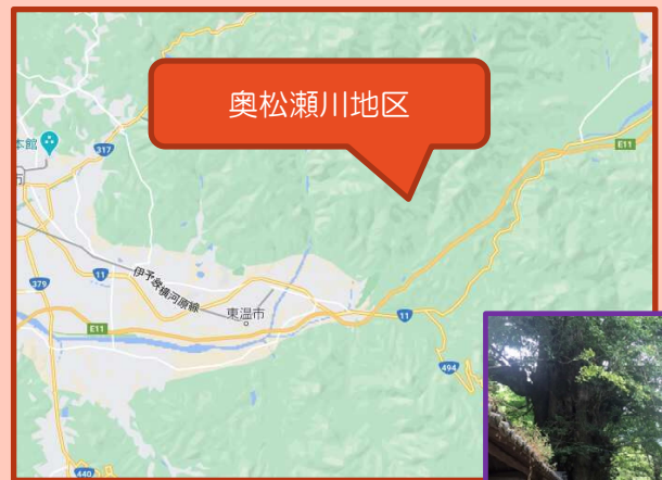
東温市奥松瀬川地区

奥松瀬川地区は、東温市の真ん中、山あいには位置しています。松山市から車で約40分。人口287人、世帯数は132世帯、高齢化率は44.9%です。豊かな自然を使って、なんでも手づくりでやってのける地元の人々の力で変化し続けている地域です。サイクリングコースとしても楽しめ、慈眼滝、篠森神社や五柱神社などの歴史ある名所や、他にも市指定天然記念物の川筋のイチョウやしだれ桜など季節を楽しめる名所があります。