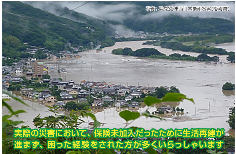
写真：平成30年西日本豪雨災害(愛媛県)

実際の災害において、保険未加入だったために生活再建が進まず、困った経験をされた方が多くいらっしゃいます