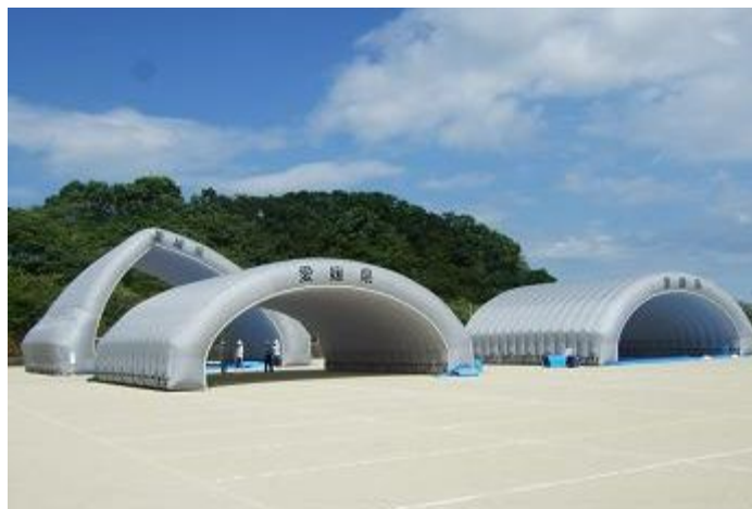
救援物資供給訓練の様子（平成 23 年度愛媛県総合防災訓練 砥部町）