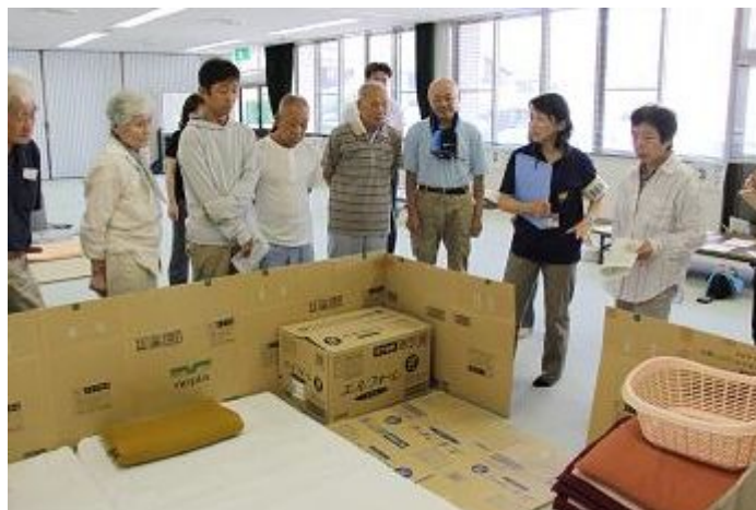
災害時要援護者要避難所開設・運営訓練の様子（平成 23 年度愛媛県総合防災訓練 砥部町）