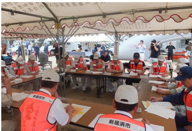
新居浜市災害対策本部訓練の様子

まず、開会宣言に先立ち、市民が参加した津波避難訓練が実施され、引き続き、中学校グラウンドにおいて、新居浜市が独自に災害対策本部訓練を実施しました。災害対策本部訓練では、被害状況等の収集、把握等の情報伝達の流れを確認しました。