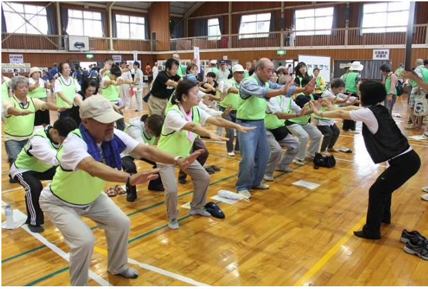
運動不足による体調悪化を防ぐ ストレッチ