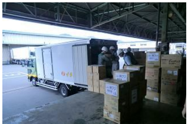
一宮運輸倉庫を物資拠点として活用

来年度も、今年以上に充実した訓練を実施したいと考えております。期待してください！！