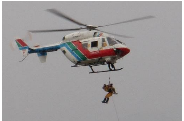
救出した生存者を防災ヘリにピックアップ