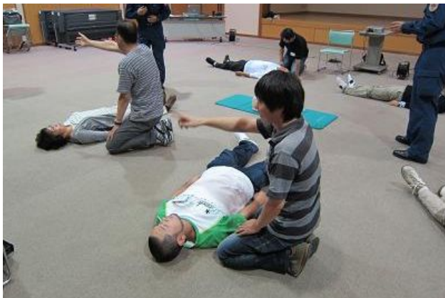
傷病者役、救助役に別れて手順を確認。

また、防災士資格試験に合格しただけでは防災士にはなれません。各消防等で実施している救命講習を修了する必要があるため、試験後には講習未修了者に対して救命講習を行いました。八幡浜消防から救急救命士の方ら5名に来ていただき、3時間の救命講習を行いました。人命にかかわる講習です。皆さん真剣に受講していました。