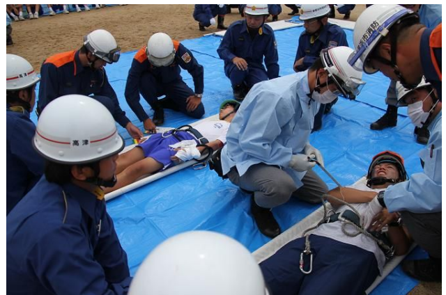
トリアージエリアでの一次トリアージ

避難所開設・運営訓練では、保健師による健康診断、衛生管理訓練の実施や、自主防災組織による生活スペース等の設営訓練、社会福祉協議会による災害ボランティアセンターの設置訓練等が行われました。