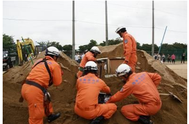
埋没車両にカメラを差込み、 生存者がいるか確認