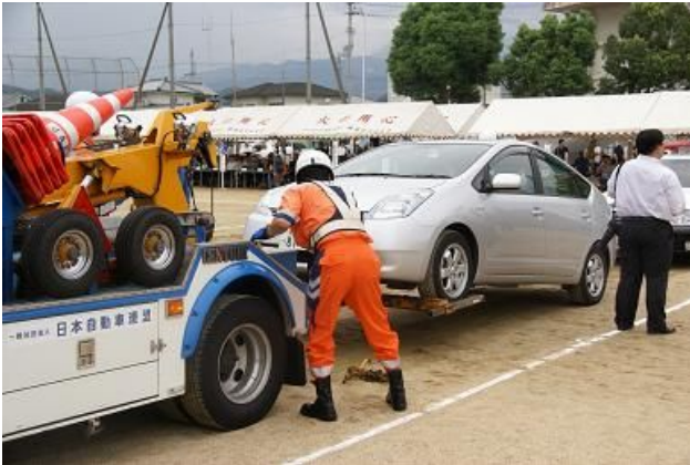
J A F により撤去される放置車両 緊急交通路を確保します