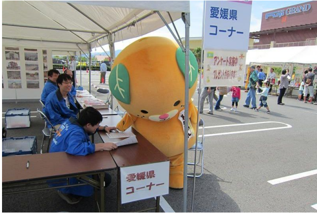
防災アンケートに協力するみきゃん

10月8日（月・祝）、松前町のエミフル MASAKI において、交通安全や防災に関するイベント「安全・安心ふれ愛フェア」が開催されました。イベントには目がないみきゃんも参加してきましたけん！