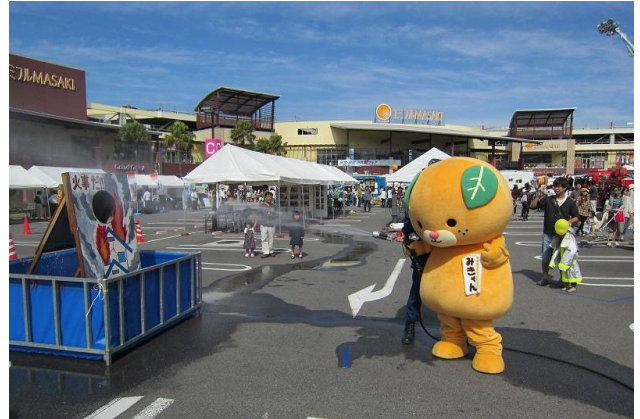
消火訓練をするみきゃん