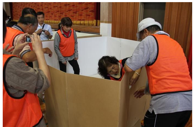
生活スペース設営のためダンボールによる ついたてを作成