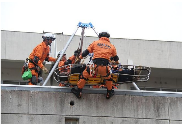
倒壊建物屋上から負傷者を救出