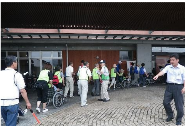
車イス利用者をプラチナガーデンに搬送