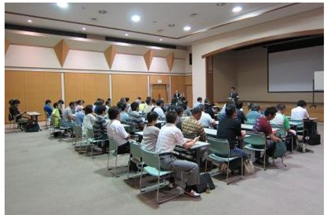
試験前の緊張した雰囲気

また、防災士資格試験に合格しただけでは防災士にはなれません。各消防等で実施している救命講習を修了する必要があるため、試験後には講習未修了者に対して救命講習を行いました。八幡浜消防から救急救命士の方ら5名に来ていただき、3時間の救命講習を行いました。人命にかかわる講習です。皆さん真剣に受講していました。