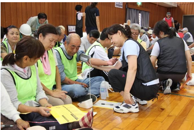
保健師による健康診断

避難所開設・運営訓練では、保健師による健康診断、衛生管理訓練の実施や、自主防災組織による生活スペース等の設営訓練、社会福祉協議会による災害ボランティアセンターの設置訓練等が行われました。