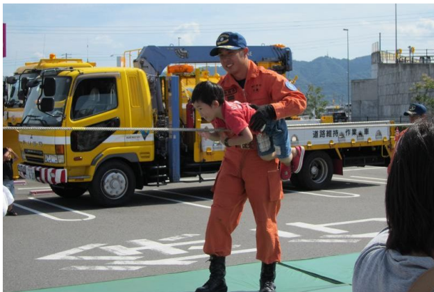
ロープによる渡過体験