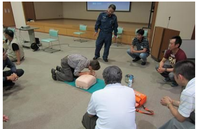
人形を使い、人工呼吸の訓練を実施。

さて、試験結果ですが、日本防災士機構から59名が見事試験に合格したとの通知をいただきました。残る4会場でも順次講座を実施していきます！結果をお楽しみに！