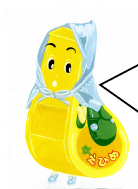
防災マスコットキャラクター ピーちゃん

ちょっと分かりにくいけど、フィルムは2層になってるっピ！ はがして実際に触ってみると、べたべたしているので糊面はすぐに分かるっピ！