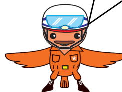
防災マスコットキャラクター こまっち