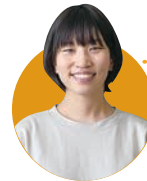
先輩から メッセージ

今後の目標は地域の事業継承であり、"子どもたちが帰ってくる地域"を実現するため、さらなる挑戦を続けていきます。