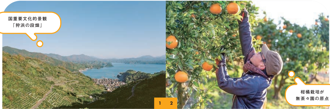
国重要文化的景観 「狩浜の段畑」