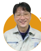
先輩から メッセージ

命を守る"ことを第一に考えながら、生態系の多様性や景観を維持できる設計と、自然に極力負荷を与えない工事計画の策定をしています。地形や地質など同じ条件は一つとしてないため、次々と新しいことに挑戦し続けることができるのも、この仕事の魅力です。