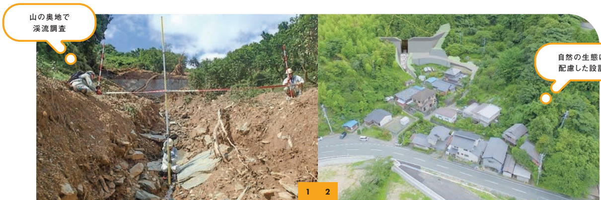
山の奥地で 溪流調査