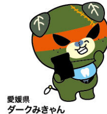
愛媛県 ダークみきちゃん