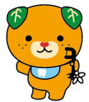
うらめん こた 裏面に答えがあるよ

ここまではクリアしたかな? 確認できたら、歯みがきをしよう♪ くわしいみがき方は裏面を見てね!