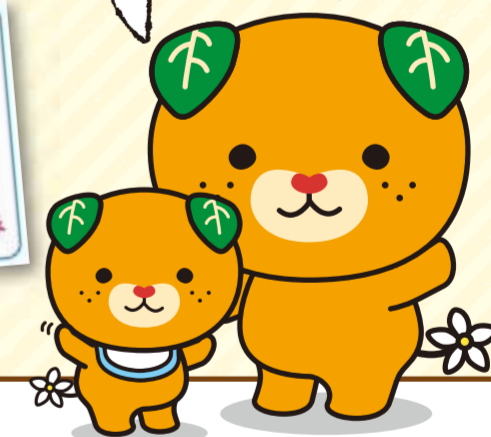
愛媛県イメージアップキャラクター みきゃん