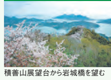
積善山展望台から岩城橋を望む