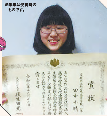
*学年は受賞時のものです。