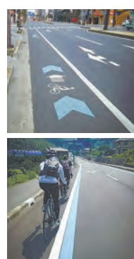
(上) 矢羽根型路面表示 (下) ブルーライン

自転車は左側の車道走行が原則! 矢羽根型路面表示とブルーライン 「シェア・ザ・ロード」を実践する「走ろう! 車道運動」実施中