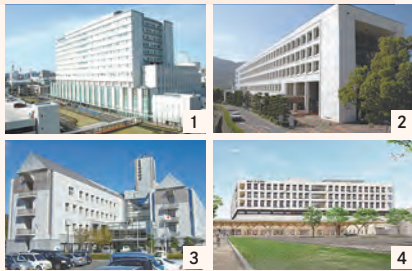
1_中央病院 2_今治病院 3_南宇和病院 4_新居浜病院

現在、県立病院で働く看護師・診療放射線技師・臨床工学技士を募集しています。看護師は6/26(土)、診療放射線技師と臨床工学技士は6/27(日)に試験を実施しますので、興味がある方は6/11(金)までに受験等申込システムからお申し込みください。