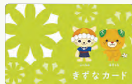
*カードデザインはイメージです。