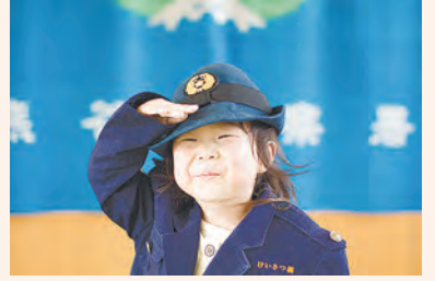
令和3年度写真部門(一般の部)知事賞