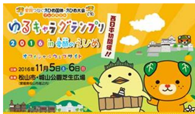
ホームページメインビジュアル