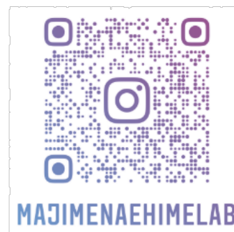
※2021年8月情報更新開始(予定)