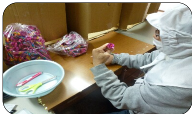
祭り熊手飾り付け