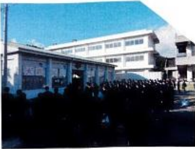
福島県立相馬農業高等学校