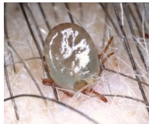
キチマダニ（吸血中）