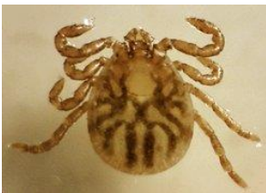
キチマダニ（吸血前） 愛媛県立衛生環境研究所