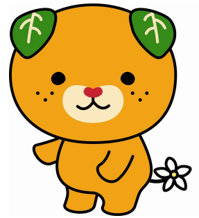
愛媛県イメージアップキャラクター みきゃん

事業所のみなさん、健康づくりに関することは、 西条保健所へお気軽にご相談ください。