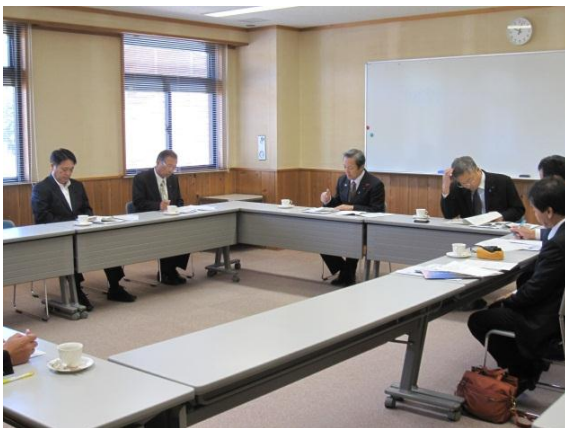
島根県中山間地域 研究センター （島根県飯南町）