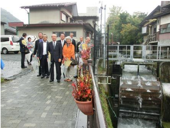
家中川小水力市民発電所 （山梨県都留市）