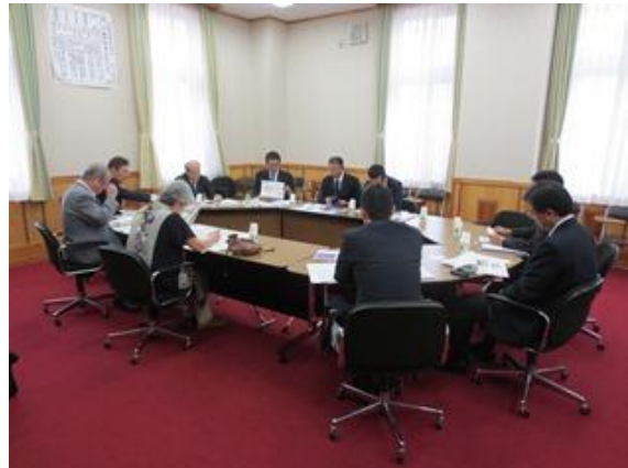
山梨県議会 （山梨県甲府市）