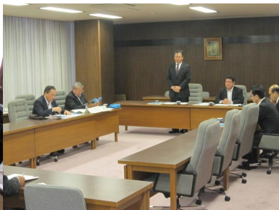
岐阜県議会 （岐阜県岐阜市）