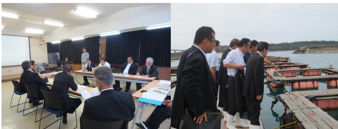
沖縄県農業研究センター 名護支所 (沖縄県名護市)