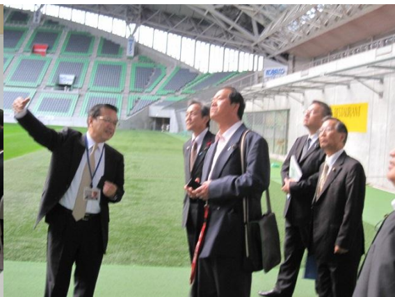
ノエビアスタジアム神戸 （兵庫県神戸市）