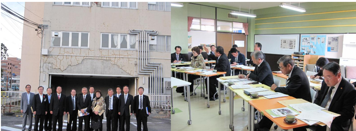
福島県警察本部 （福島県福島市）