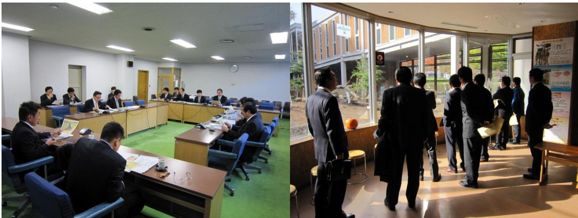
北海道庁 (北海道札幌市)