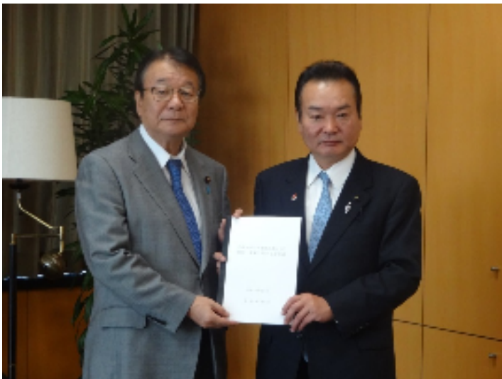
（山本防災担当大臣と鈴木議長）

提出した意見書は、7月豪雨災害に対応し本県議会が設置した「愛媛県議会平成30年7月豪雨復興支援対策本部」の活動の一環として、正副議長、同対策本部役員会のメンバー及び地元議員が被災自治体から直接、要望聴取を行い、その要望事項や意見等も踏まえ、同対策本部役員会においてとりまとめたものです。