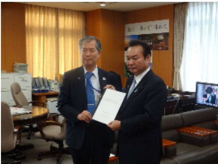
（藤原事務次官と鈴木議長）