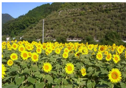
【ひまわりの作付状況】