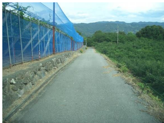
【鳥獣害防止対策(左)ネット(右)電気柵】