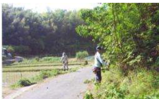
【農道・水路の管理活動】