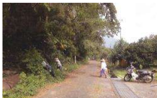
【農道・水路の管理活動】