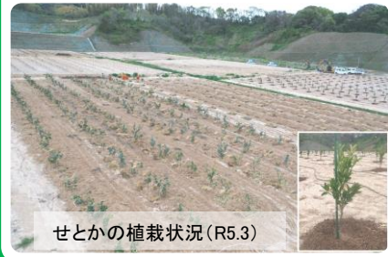
せとかの植栽状況 (R5.3)