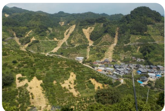
宇和島市吉田町白浦