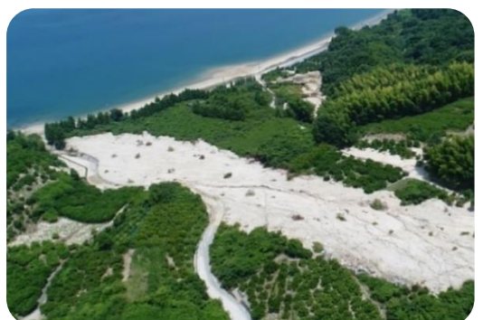
今治市上浦町盛 (大三島)