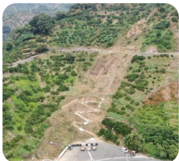
宇和島市吉田町白浦