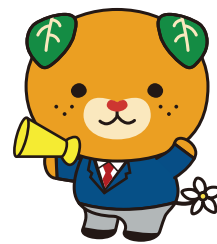
愛媛県 イメージアップ キャラクター みきゃん

※各セミナー後、従業員意識調査アンケートなどの課題に取り組んでいただく可能性がございます。あらかじめご了承ください。 ※携帯メールアドレスはご登録いただけません。 ※ご登録いただいた情報は適正に管理し、本事業のみに利用いたします。