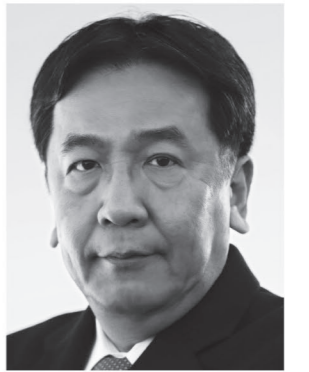
立憲民主党 代表 枝野幸男