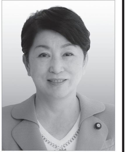
社民党党首 福島みずほ