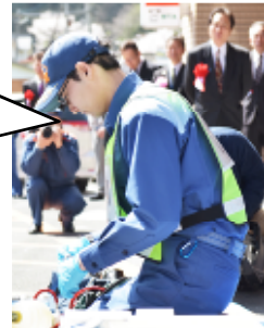
藤代准救急隊員 産業建設課併任

救急出動の時は不安や心配があったが、消防学校や所属署内の研修で学んだ経験を生かして頑張りたい。