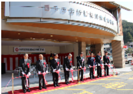
民間企業の遊休施設を改修した 城川出張所テープカットの様様

・救急出張所が新たに誕生することで新庁舎が必要となるが、明浜救急出張所は平成 31 年に完成予定の新明浜支所に併設予定とし、それまでは旧高山診療所の一部分を仮庁舎、医師住宅を隊員宿舎とした。また、城川救急出張所は愛媛銀行と協議し、主要道路沿いで城川町のほぼ中心にある旧愛媛銀行しろかわ支店を改修し、救急出張所として使用することで、施設にかかる財政負担を最小限に抑制できた。