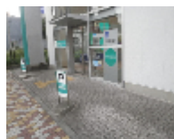
店舗前の空きスペース