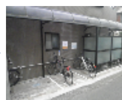
駐輪場とした活用例