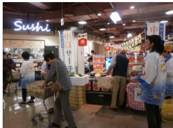
中島サーモンの試食販売