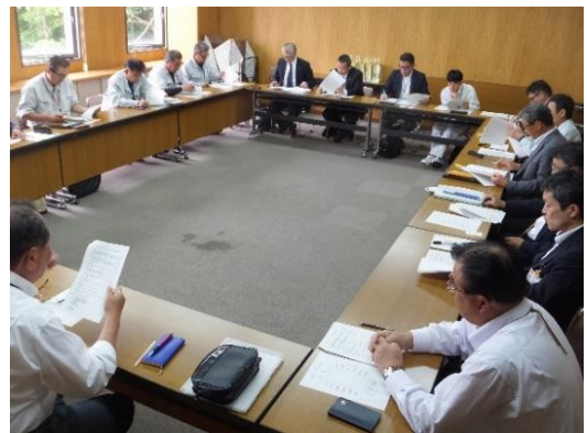
源吉兆庵ファクトリーブランド促進協議会