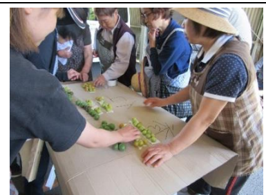
出荷規格を確認する生産者