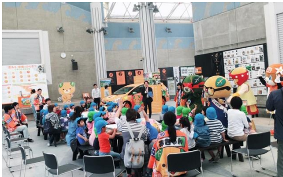
「みきゃん出張所」オープニングイベント