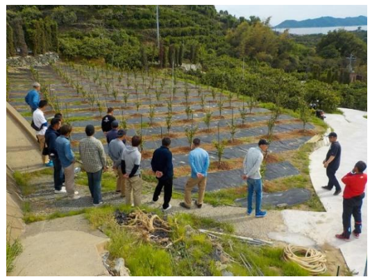
対象者との現地ヒアリングの様子