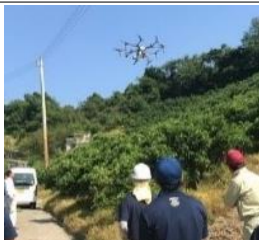
モデル園でのドローン飛行