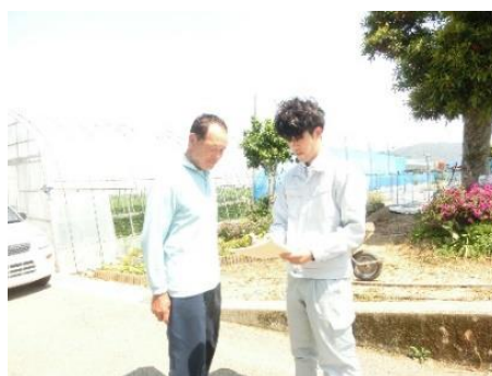
聞き取り調査を行う普及員