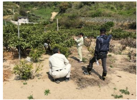
被災園の巡回調査(興居島地区)