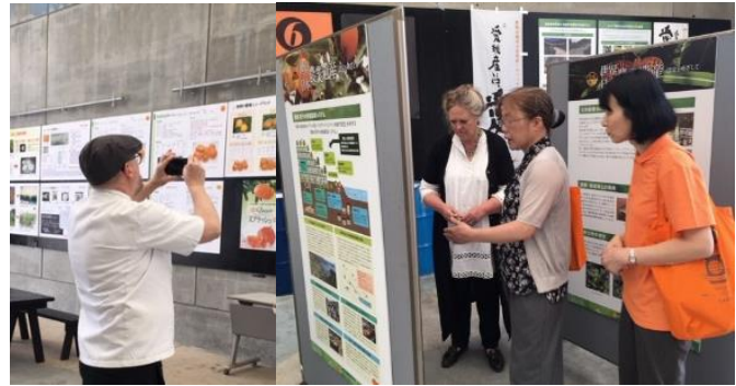
英国大会主催者らも、パネルに関心を寄せる