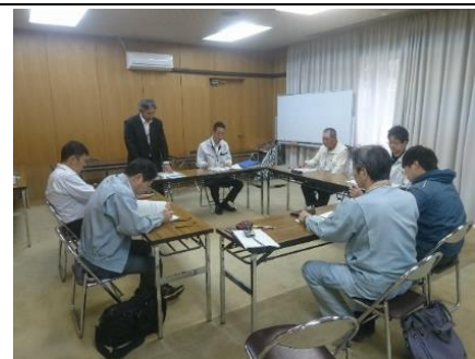
栗の産地力向上プロジェクト会議