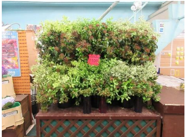
今治産花木を用いたディスプレイ