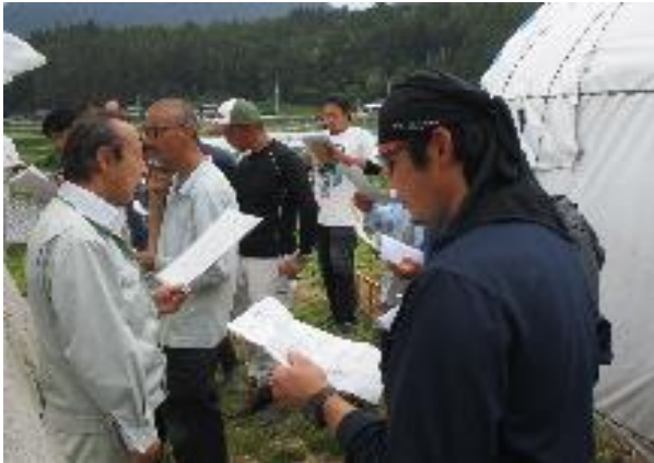
細霧冷房の効果を説明する普及員