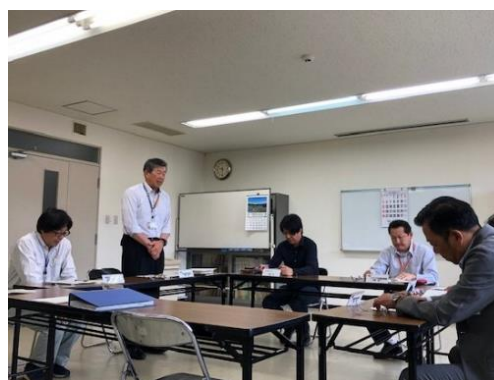
河内晩柑魅力発信協議会