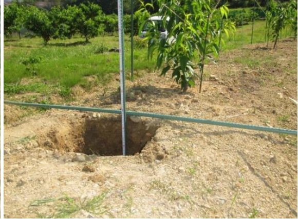
根域の掘取り調査