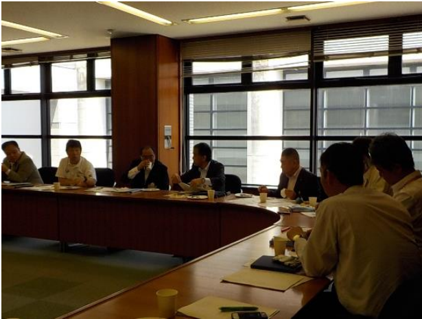
オリーブ特産化推進連絡会