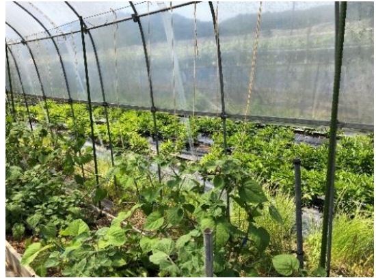
ほおずきの整枝法の実証圃