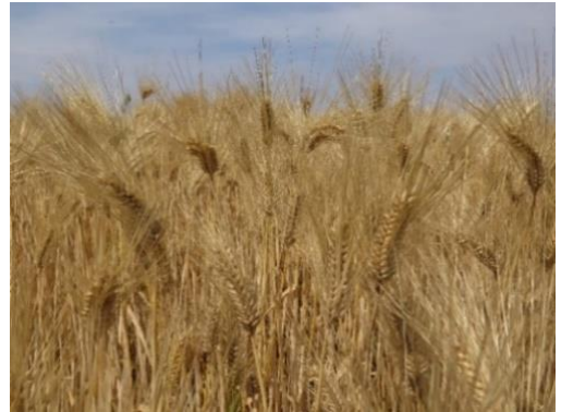
穂が長く粒張りの良いハルヒメボシ