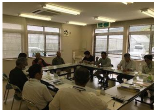
うめの里再興検討会