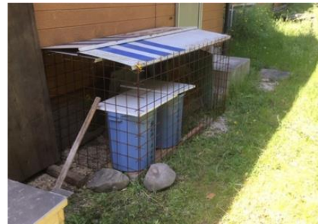
集落住民が自由に持ち込める「米ぬかバンク」