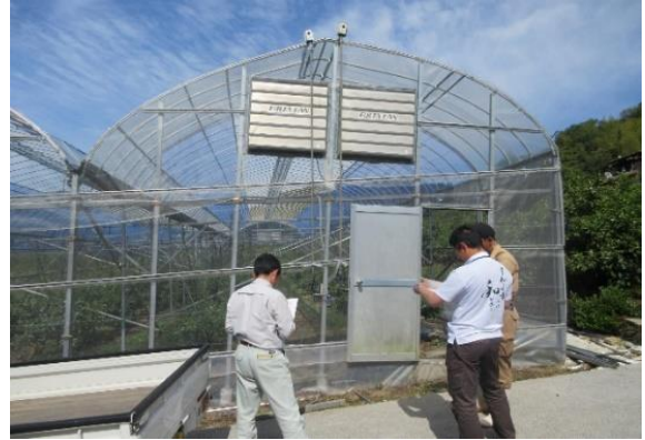
対象者との現地ヒアリングの様子