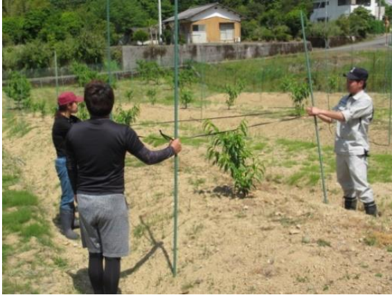
誘引支柱を立てる生産者と若手普及員