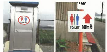
川上地区のトイレと案内板

昨年のアンケート結果よりトイレ整備の希望が56%と高かったことから、園地トイレの整備を推進し、伊方町でトイレを3基整備した（予定：大浜、中浦、川永田地区）。また、八幡浜市川上地区では、昨年整備したトイレに案内板を設置し好評を得た。なお、管内のトイレ施設整備は20箇所となった。