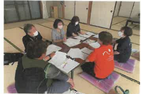
高野地地区労働環境整備検討会

各雇用促進協議会では密を避けるために、県外アルバイト宿泊先の個室化改修を進めた。併せて新たなシェアハウス確保に向けて空き家の情報交換を進め、町見地区の廃所となった保育所の改修1件、大久地区と三崎地区で空き家2件を確保し、管内の共同宿泊施設は16件となった。