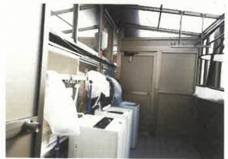
アルバイトの要望を取り入れた女性用洗濯室

高野地地区では国の女性活躍推進対策事業を活用してシェアハウスの改修に取り組むこととなり、女性アルバイトの要望を踏まえた洗濯室や更衣室を整備した。当室では、事業実施に係る女性農業者活躍促進計画の作成を支援した。