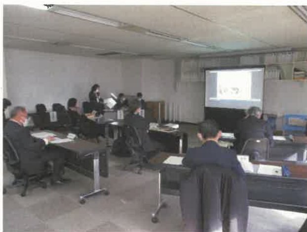
全体評価（令和4年1月17日）