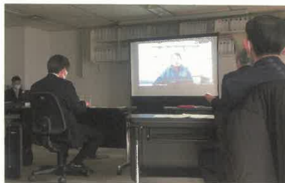
八幡浜現地調査（令和4年1月17日）