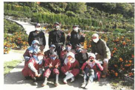
検査で陰性を確認して作業する 県外アルバイト

伊方町大久地区では労働力確保の意見交換を進め、8月26日に新たに雇用促進協議会を設立した。同地区では8戸の農家がアルバイトを2人雇用し収穫を行った。