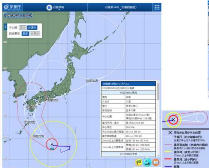
図1 台風経路図の例

また、5日（120時間）先までに暴風域に入る確率の分布図（図2）、市町村等をまとめた地域ごとの時系列図（図3）を6時間ごとに発表します。なお、暴風域に入る分布図では、5日先までの積算確率と、3時間毎の確率を確認することができます。