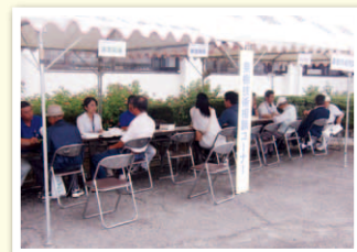
▲果樹技術相談コーナー