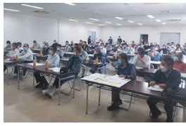
認定栽培者講習会

“ひめの凩”は、愛媛県が美味しい米づくりへの意欲にあふれる方々を認定栽培者として認定し、その方々だけが栽培をしています。認定された栽培者は、“ひめの凩”の実力をしっかりと引き出すため、講習会に参加し、栽培マニュアルや県・JAの指導を遵守し、愛情を込めて栽培をしています。