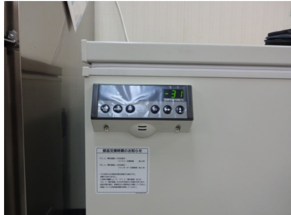
サンプル保存冷凍装置本体