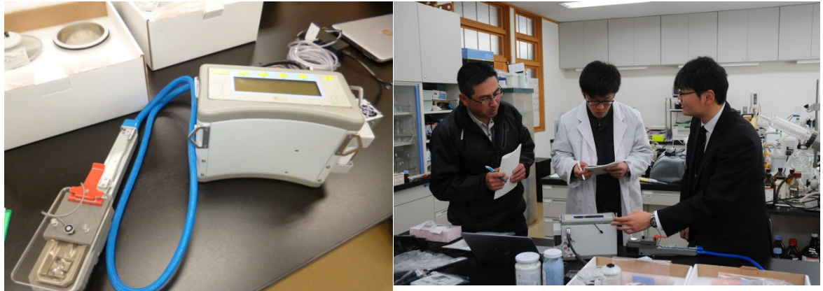
光合成蒸散測定装置本体

本装置の導入により、 光合成・蒸散量 の生理学的な知見を明らかにするとともに、高品質安定生産を可能とする技術開発につながります。