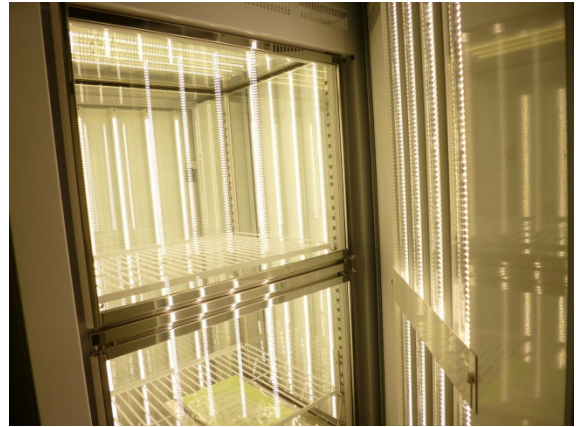
人工気象器（左：外観、右：内部）