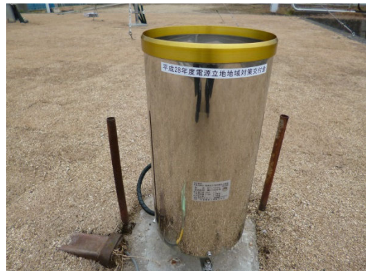
気象観測装置 (温度計、日射計、雨量計ほか)