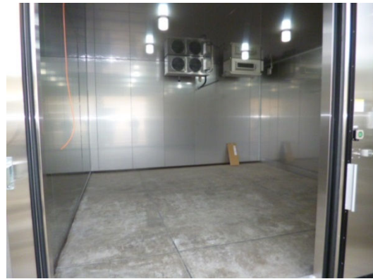
低温種子庫本体 (左: 外観、右: 内部)