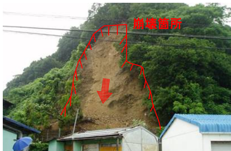
がけ崩れ発生直後（H24.6）