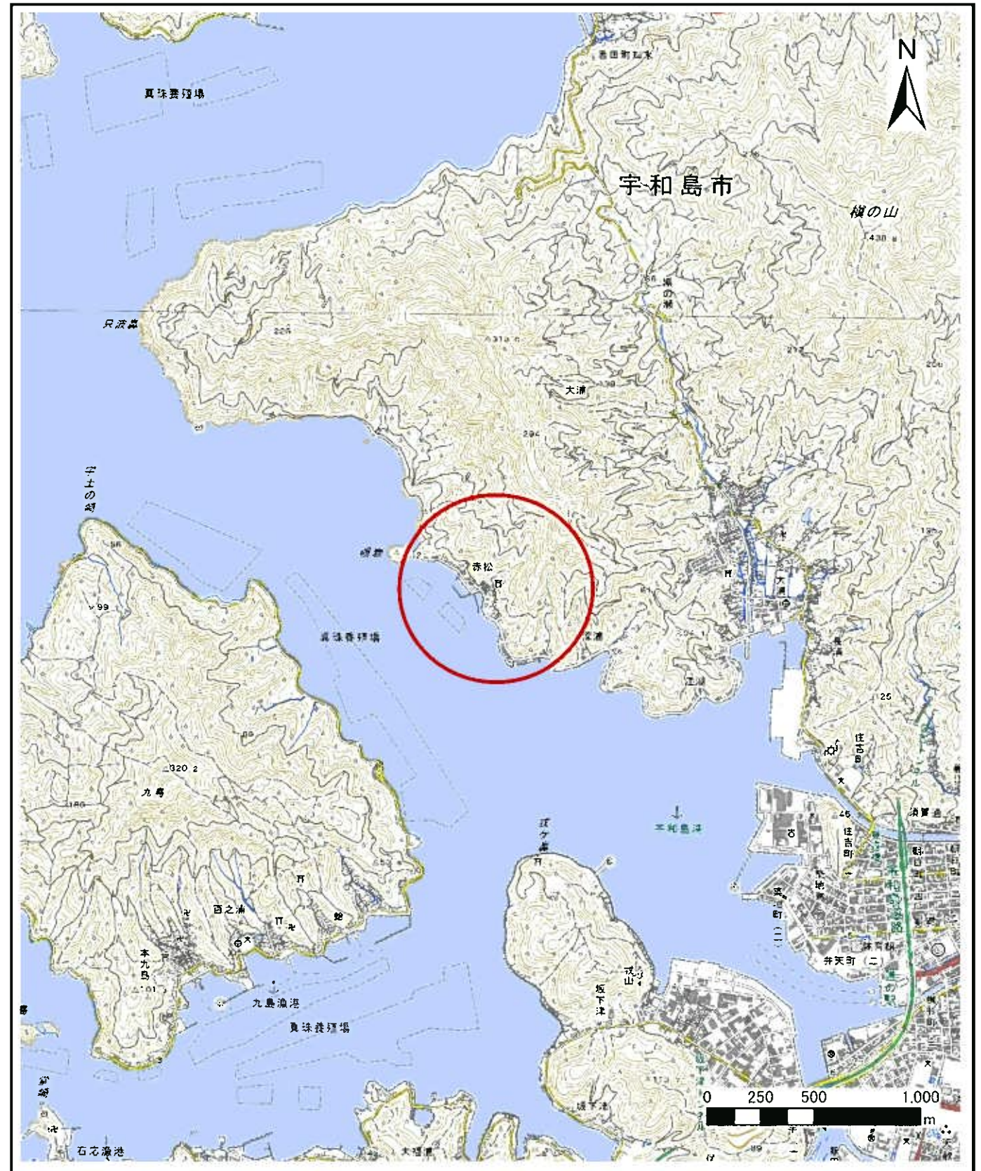
様式-1 (土) 土砂災害警戒区域・特別警戒区域 位置図