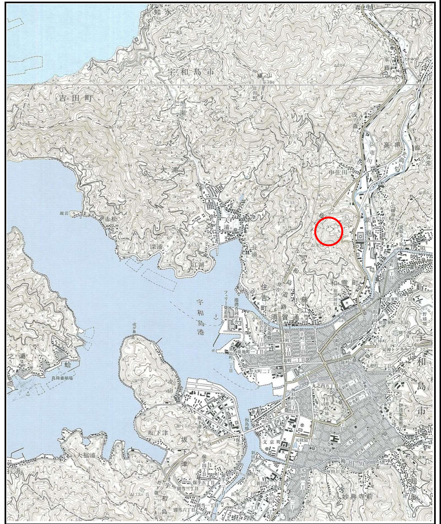
様式-1 (土) 土砂災害警戒区域・土砂災害特別警戒区域 位置図