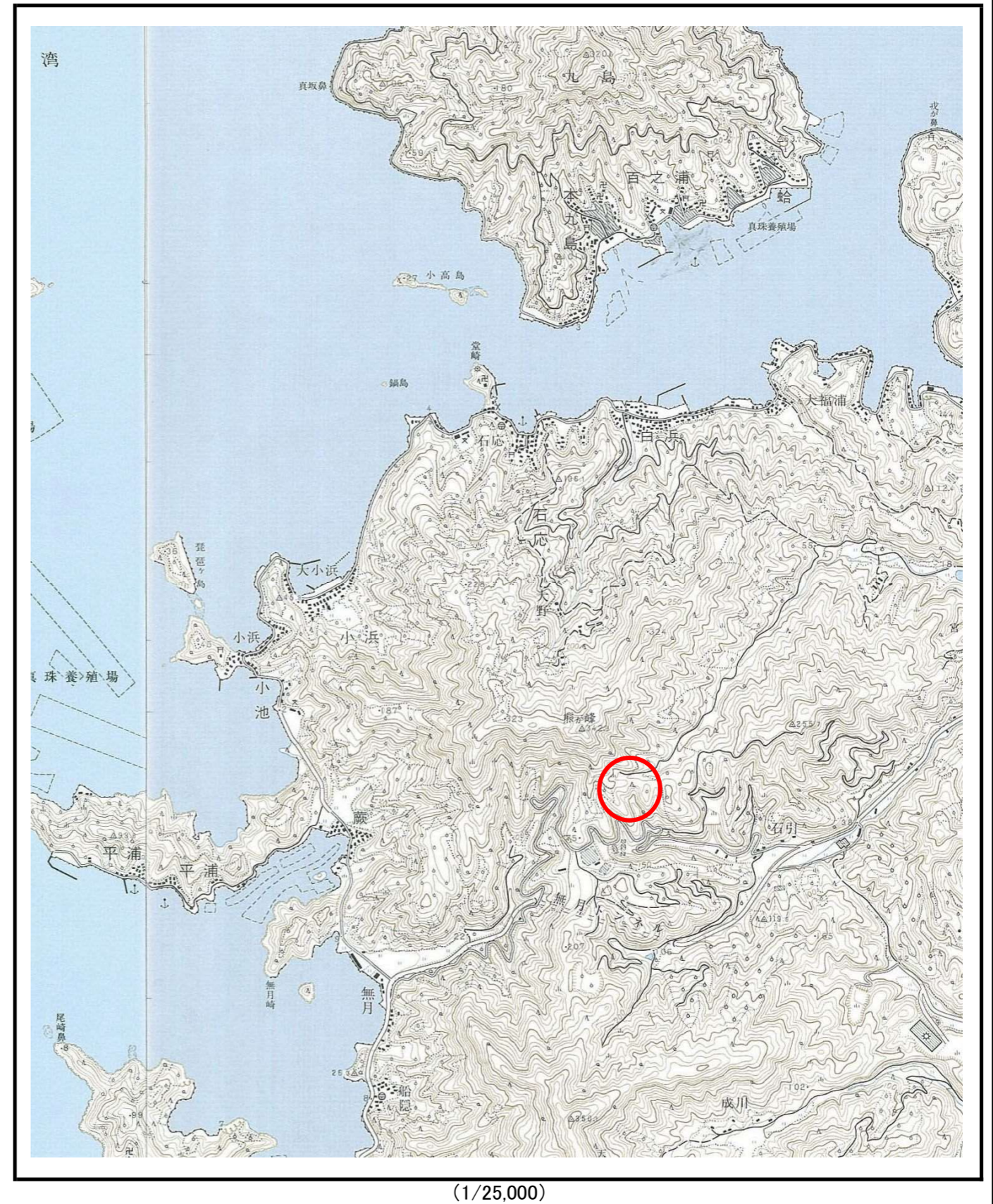
様式-1 (土) 土砂災害警戒区域・土砂災害特別警戒区域 位置図