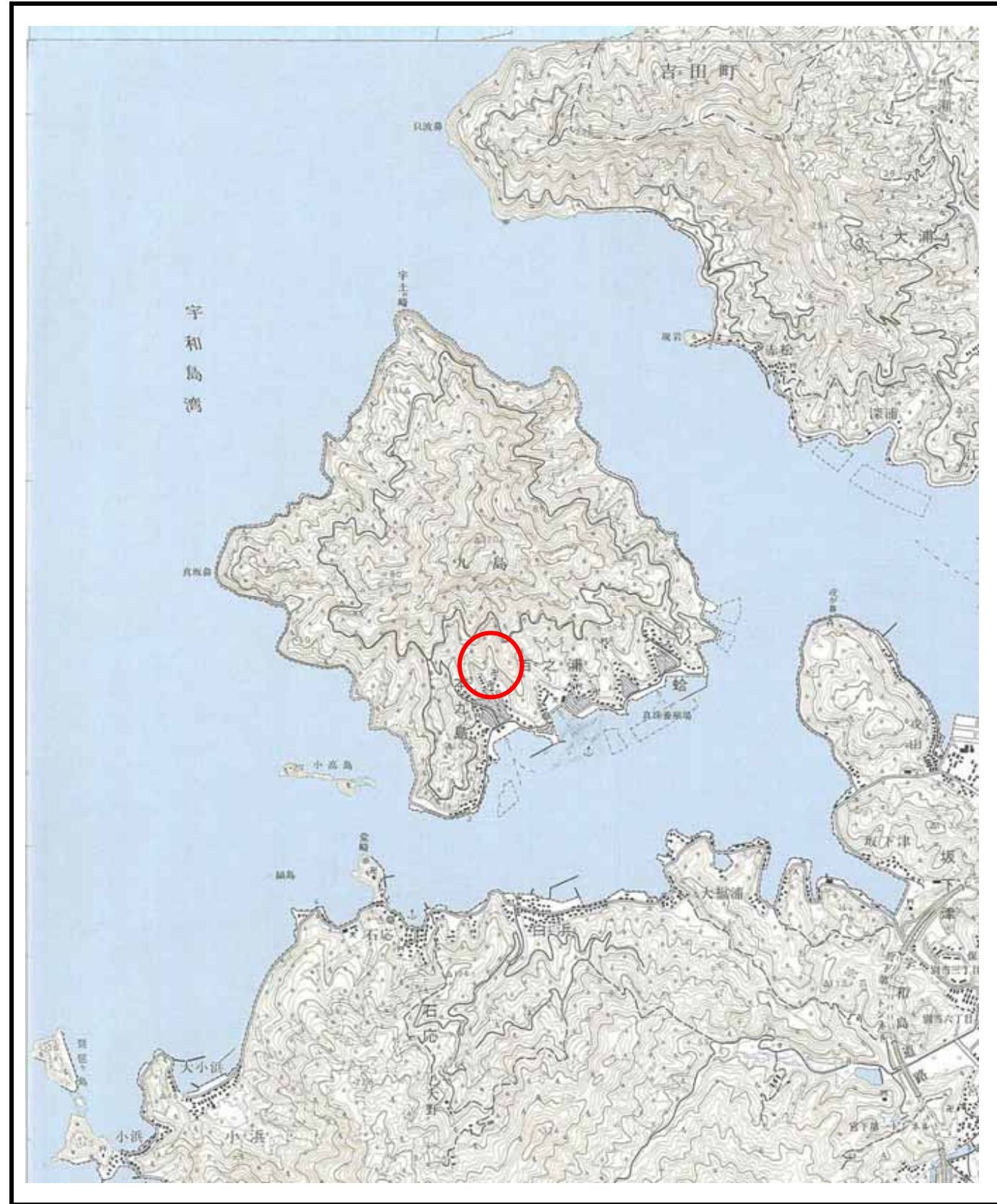
様式 - 1 (土) 土砂災害警戒区域・土砂災害特別警戒区域 位置図