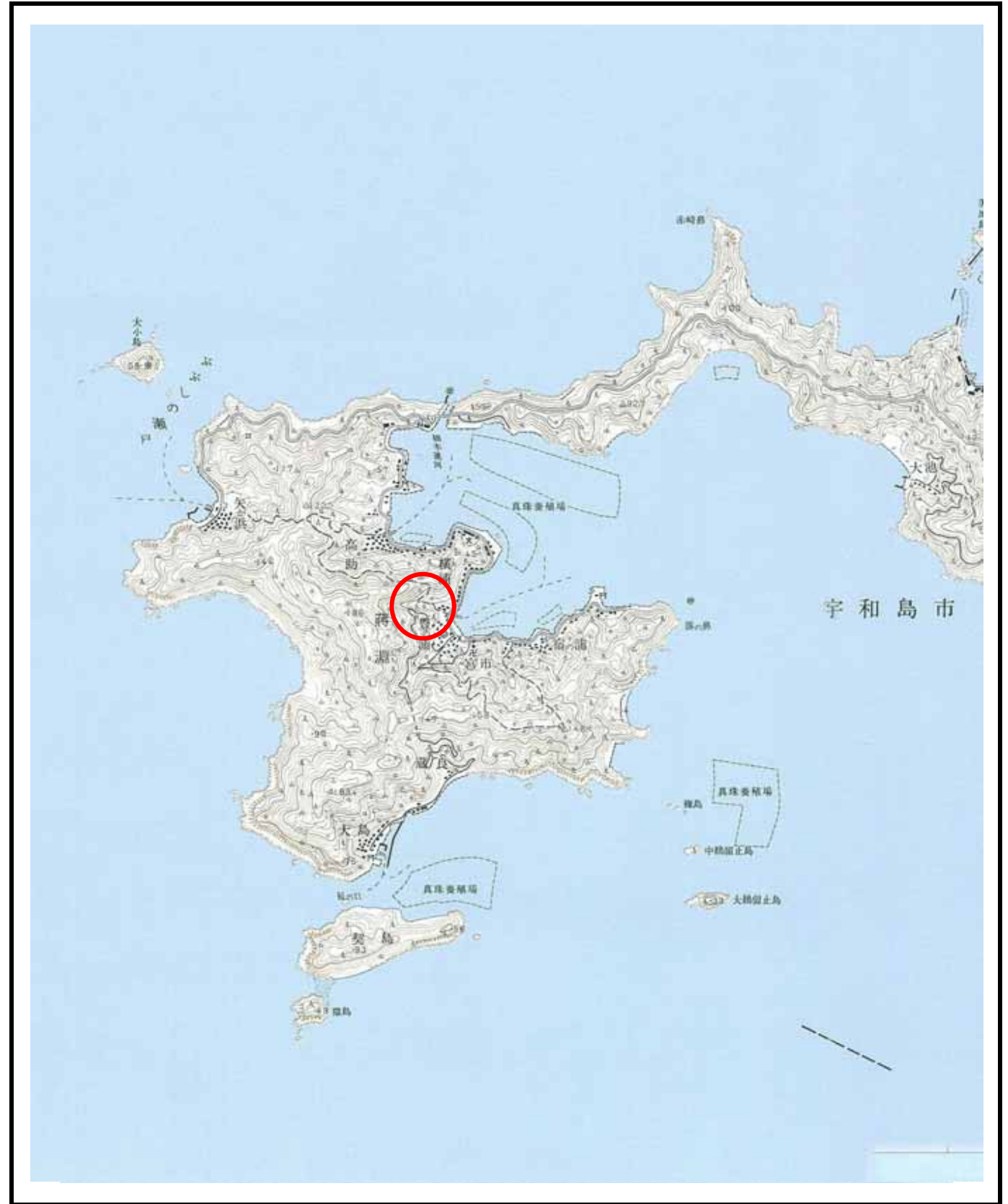
様式 - 1 (土) 土砂災害警戒区域・土砂災害特別警戒区域 位置図