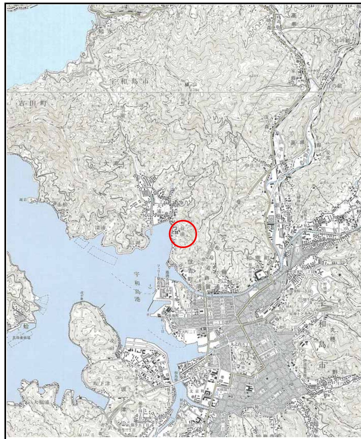
様式 - 1 (土) 土砂災害警戒区域・土砂災害特別警戒区域 位置図