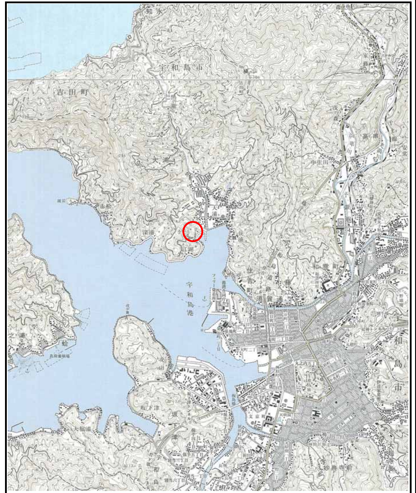
様式 - 1 (土) 土砂災害警戒区域・土砂災害特別警戒区域 位置図