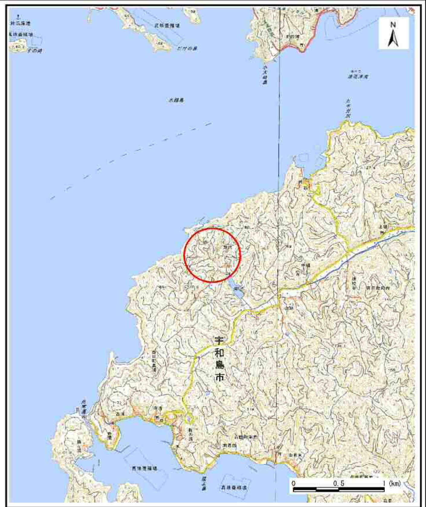
様式-1 (急) 土砂災害警戒区域・土砂災害特別警戒区域 位置図