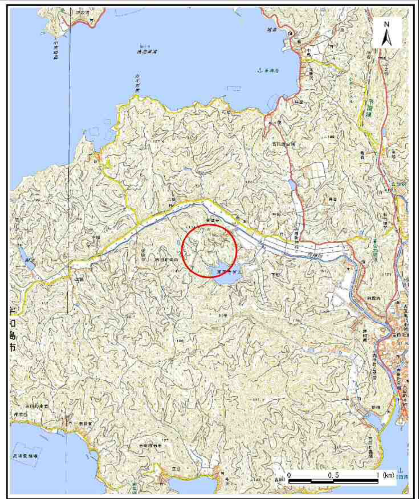
様式-1 (急) 土砂災害警戒区域・土砂災害特別警戒区域 位置図